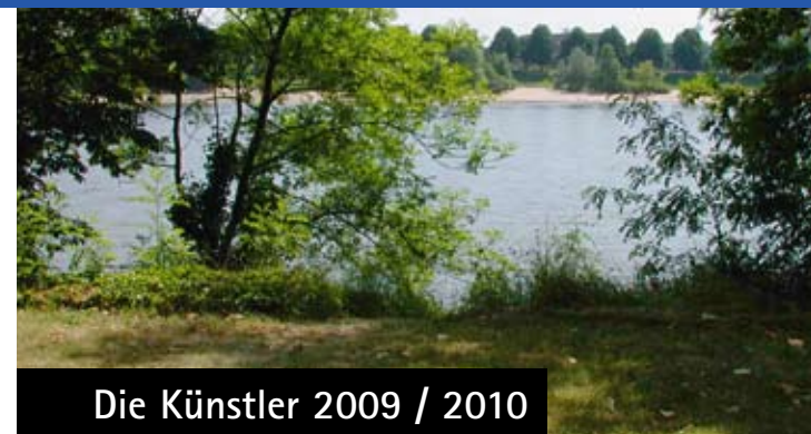
Die Künstler 2009 / 2010