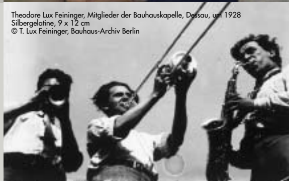
Theodore Lux Feininger, Mitglieder der Bauhauskapelle, Dessau, um 1928 Silbergelatine, 9 x 12 cm