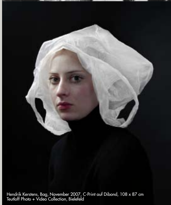
Hendrik Kerstens, Bag, November 2007, C-Print auf Dibond, 108 x 87 cm Teutloff Photo + Video Collection, Bielefeld