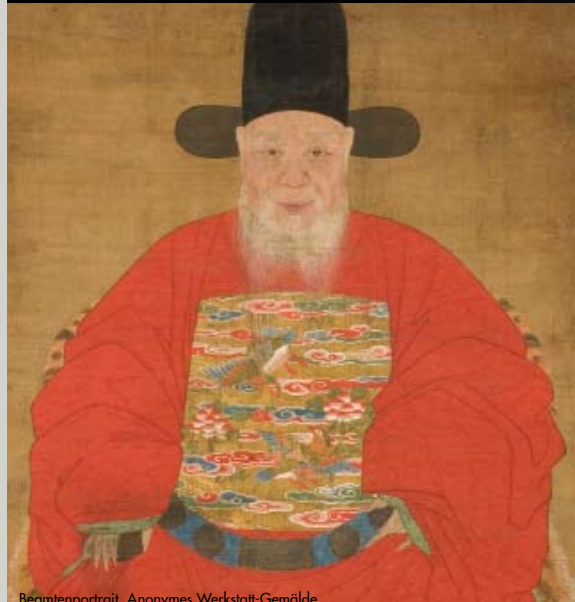
Beamtenportrait, Anonymes Werkstatt-Gemälde Hängerolle, Tusche, Farben und Goldpigmente auf Seide, 180 x 85,7 cm China, Ming-Dynastie, datiert 1607 Museum für Ostasiatische Kunst Köln, Inv. Nr. A 38,2, © Rheinisches Bildarchiv Köln